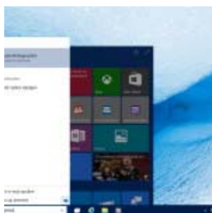
aanmeldopties Windows 10

Een Windows computer gebruikt standaard een wachtwoord om u aan te melden op uw computer. Deze opties omtrent de aanmeldprocedure vind u bij gebruikers. Dit onderdeel opent u in het startscherm van Windows 8 via de Charms-balk (sneltoets Win +C) waar u kiest voor Instellingen / pc-instellingen wijzigen / accounts . Onder aanmeldopties kunt u de instellingen het wachtwoord, de pincode of het afbeeldingswachtwoord bepalen en aansluitend instellen.